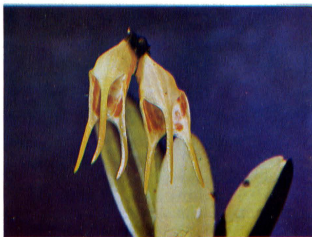
Masdevallia geminiflora P. Ortiz

Plantas medianas, epífitas o terrestres, cespitosas. Raíces delgadas, flexuosas. Tallos abreviados, de hasta 1 cm. de longitud, cubiertos por tres vainas tubulosas. Bases foliares acanaladas, de aprox. 1 cm. de longitud. Hojas erectas, coriáceas, estrechamente elípticas, de 4-6 cm. de longitud y 0.7-0.9 cm. de anchura, pecioladas, con ápice obtuso, diminutamente triapiculado. Inflorescencias solitarias, un poco más largas o aproximadamente igual de largas que las hojas; pedúnculo terete, de 5-7 cm. de longitud; bráctea floral infundibuliforme, de 0.5-0.7 cm. de longitud; pedicelos de aprox. 0.5 cm. de longitud; ovario de 0.2-0.3 cm. de longitud. Flores blancas o cremas con manchitas de color anaranjado o marrón pálido en los sépalos laterales y con caudas amarillas; flores acampanuladas, con un mentón poco prominente en la base. Sépalos de 2 cm. de longitud total, conatos hasta la mitad, los laterales más largamente, atenuados hacia el ápice, con caudas carnosas, la del sépalo dorsal de 1 cm. de longitud, las de los laterales de aprox. 0.6 cm. de longitud. Pétalos blancos, o-